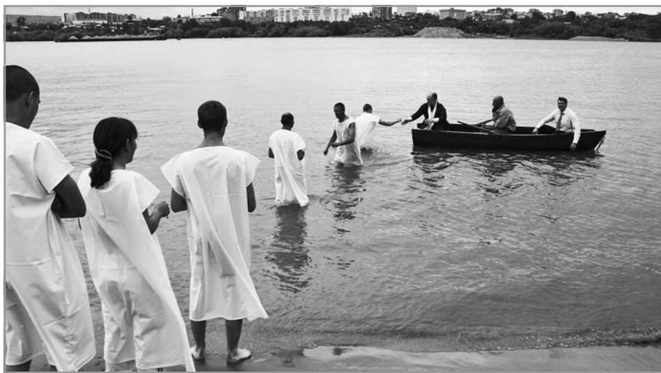
Крещение в Оби

– Совершенно верно. Только в настоящее время ситуация изменилась. Деятельность некоторых тоталитарных сект стали наконец-то запрещать. А когда мы только начинали, наше законодательство не было готово к радикальным мерам. Да и никто не знал, что это за организации, насколько они опасны. С одной стороны, нам верили, с другой – ничего не предпринимали в отношении сект. Но хотя бы принимали нашу информацию к сведению. А мы говорили не только о мошенничестве на доверии и даже гипнотическом воздействии на людей без их ведома, которые использовали и продолжают использовать сектанты, но и об экстремистской направленности их деятельности. Время показало, что мы были абсолютно правы. К примеру, сегодня неопятидесятнические и неоязыческие объединения косвенно или напрямую поддерживают политику украинского режима. На Украине и в странах Средней Азии проходят террористическую подготовку члены запрещенного в нашей стране ИГИЛ, которых потом забрасывают на территорию России для проведения терактов. Мы начали вести антитеррористическую работу, проводить лекции и выступать с докладами на антитеррористических конференциях, вскрывая связь тоталитарного сектантства с экстремизмом и терроризмом. Нам пришлось даже изменить название центра, теперь оно звучит так: Информационно-консультационный