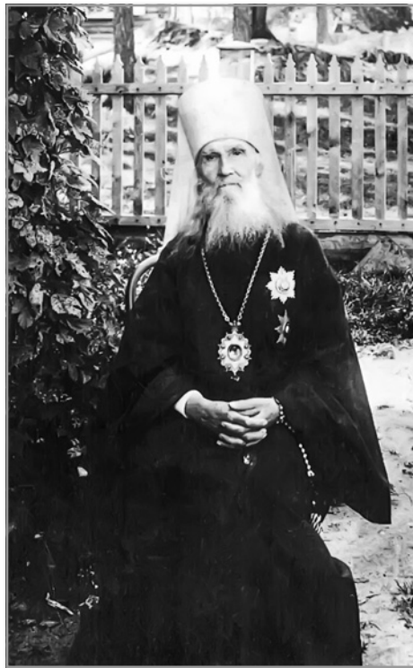
В Николо-Угрешском монастыре. Фото не позже 1920 г.

Возьмите пример с садовника: как он поступает с посаженными деревьями? Он привязывает их к кольям, чтобы ветер не колебал их и не портил корни. Так и вы, родители, утверждайте детей в добрых правилах страхом Божиим. Внушайте им, что Бог всё видит, всё слышит, всё знает; не только видит дело, но и знает мысль и судит намерение. Помня это, дети будут беречься от дурных поступков, не только явных, но и тайных.