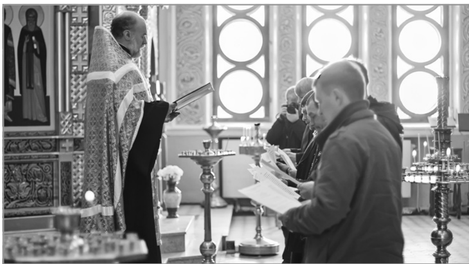
Чин присоединения к Православной Церкви временно отпавших от нее людей