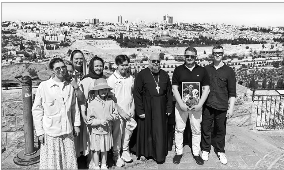
Паломники на Святой Земле

православные христиане. Это не так. Паломничество по святым местам притягивает очень многих людей, даже тех, кто и в церковь никогда не ходил. Просто у одних есть интерес узнать о жизни святых из уст православного священнослужителя, а не светского гида, часто недостаточно компетентного в этом вопросе. Другие едут за компанию со своими православными знакомыми, родственниками. Есть и другая категория паломников – ранее они тоже не ходили в церковь, но отправились в паломничество, чтобы сугубо помолиться о чем-то своем, например, о создании семьи, рождении ребенка, пошатнувшемся здоровье, приобретении жилья, новой интересной работе и так далее, полагая, что молитва у раки святого или чудотворной иконы будет более действенной.