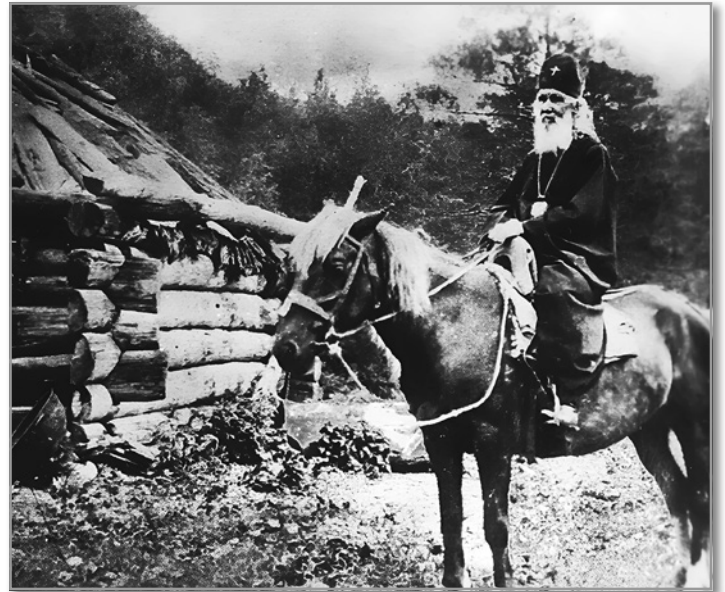
Святитель Макарий на Алтае

Люди любили епископа-миссионера. Вот как его встречали, например, в Ынырге в 1888 г.: «Народ не