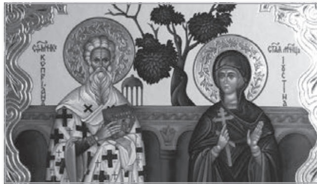
Свв. Киприан и Иустина. Фрагмент иконы.

Если человек имеет дело с обманщиком высокого класса, то легко может попасть в зависимость от этого «специалиста». Ведь те, кто занимается такого рода практиками ради денег, заинтересованы в том, чтобы надолго к себе привязать клиента. Многие становятся со временем хорошими психологами, легко определяя уязвимые места и ниточки, за которые можно