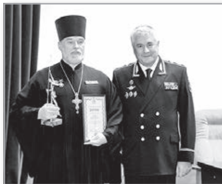
С Министром МВД России В.А. Колокольцевым