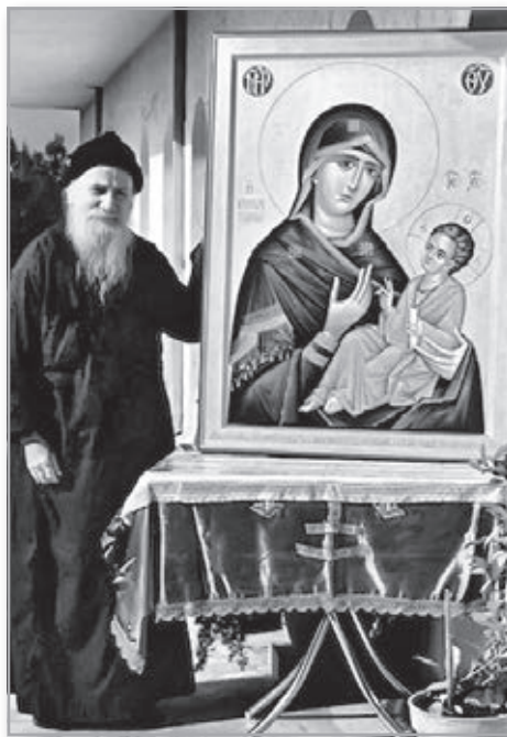
Старец Порфирий Кавсокаливут

– Отче, мне надо что-то сказать вам. В прошлый раз, когда я приходил, я увидел одну девушку. Она произвела на меня сильное впечатление,