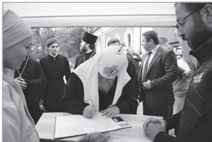
27 сентября 2016 года Патриарх Кирилл ставит подпись За запрет абортов

Кто-то точно сказал: «Цивилизация – это запреты». Если порок не запрещен и даже не ограничен законами страны, то неизбежно общественное мнение приходит к тому, что ничего страшного в нем нет, что это просто разновидность нормы. Нетрудно догадаться, что в обстановке такой «терпимости» порок растет как на дрожжах, и вскоре может оказаться, что именно его объявят нормой, а уклонение от него – преступлением. Что мы и пожинаем сейчас, читая данные по последнему «иссле-