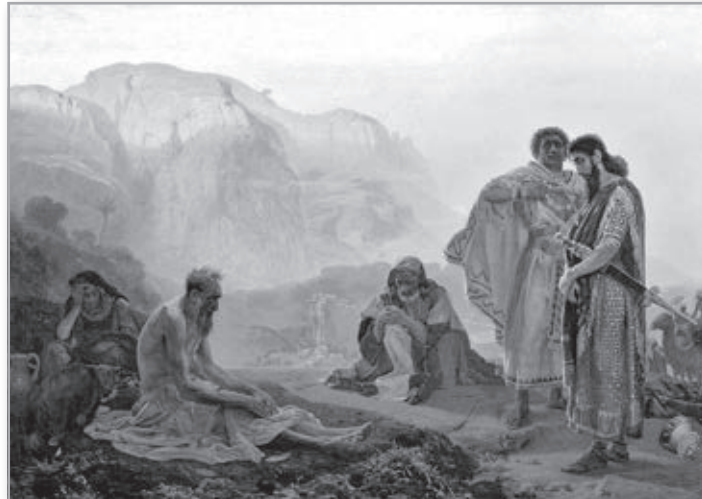
И. Репин. Иов и его друзья. 1869 г.

ветных реалий, отбрасываемые назад, в историю, и видели древние святые, пророки, праотцы. Одним из таких свидетельств, которым особенно ярко явлен Крест Христов, – тень этого Креста, отбрасываемая в древность,