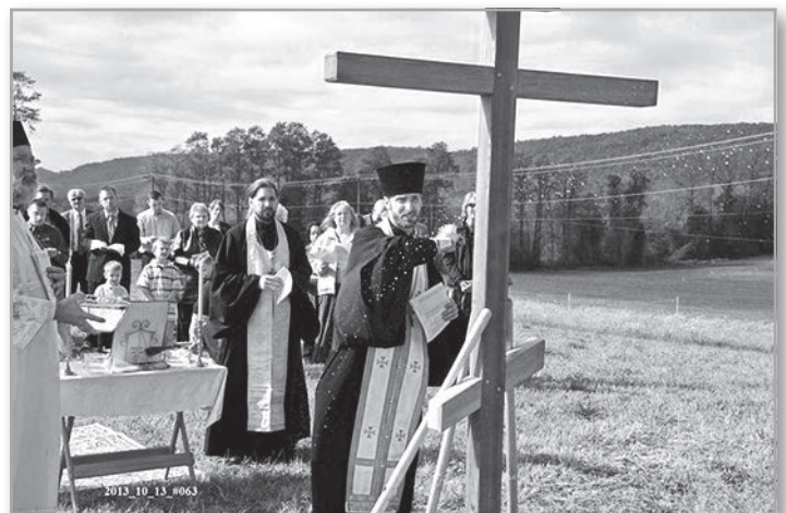
Отец Тимоти освящает крест на месте строительства будущего храма