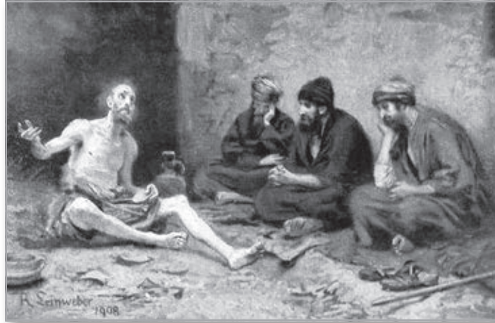
Р. Ляйнвебер. Иов многострадальный

Но есть у Иова и некое ошибочное воззрение, о котором говорят святые отцы. И за него Иов действительно приносит затем покаяние Господу. Дело в том, что Иов ошибочно считает, будто причина его страданий,