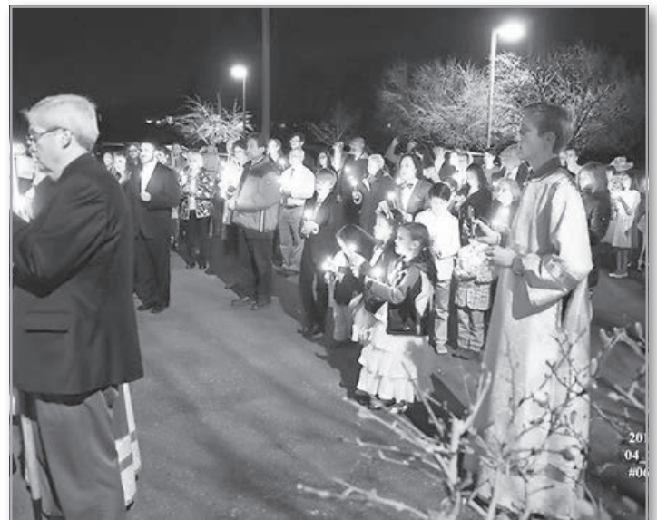
Пасха, 2015 г.

– Да. Моя бабушка рассказала мне отличную историю. Однажды в торговом центре к ней подошел человек и спросил: «Мэм, во что вы верите?» В первый момент она просто замерла, но потом сказала то, что знала: