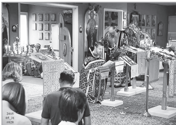
Приход Святых апостолов в настоящее время. Служба Пятидесятницы

В последнее время не получалось, но раньше я посещал Колледж Мессии (Messiah College) 1 довольно часто, чтобы представить свидетельство о Православии, и совершал богослужения в кампусе. Когда я пришел впервые, они пожелали, чтобы я служил литургию, но в течение 45 минут и чтобы не было других православных христиан. Я сказал, что так нельзя, но мы могли бы послужить другие службы. Мы служили вечернюю, утреннюю или молебен несколько раз, чтобы они получили начальное представление о Православии, а потом проводили беседы.