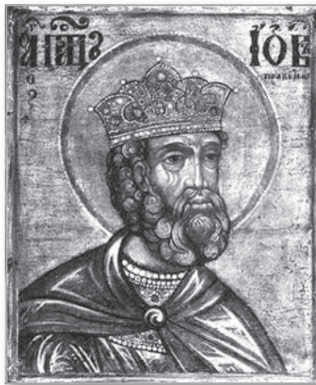
Св. праведный Иов Многострадальный

как на Премудрость воплощенную, Которая все устроила, все приготовила для блага человека в мире и Которая Сама спасет человека через крест и воскресение. И здесь – тоже указание на премудрый и предвечный замысел, который от века существует – замысел о спасении человека. Потому что Бог, еще даже не создав мир, по Своему абсолютному предведению и всеведению знает, что Адам согрешит, и творит мир таким, чтобы в