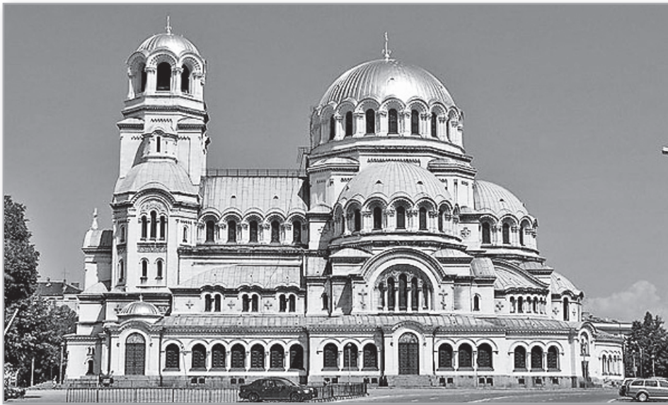
Храм во имя святого князя Александра Невского в Софии

блгв. князю Александру Невскому. Князь был глубоко почитаем императорской фамилией, имел с ней и кровные связи. А почил Александр Невский в Городце Волжском под