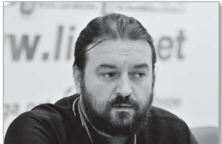
Протоиерей Андрей Ткачев

Вы усматриваете наступление оного дня? Я хоть и слеп, как крот, но усматриваю. Особенно если перечитаю посмертные вещания Нила Мироточивого. Тот говорит, что сребролюбие – есть предтеча антихриста. Сребролюбие – это дух, тонко разливающийся и проникающий глубоко в помыслы, а проникнув, формирующий мировоззрение и весь образ жизни. Нет сомнения, что такая антидуховная работа кропотливо делается, спорится во множестве душ. Ее не видно по причине грубой завесы плоти, но она обнаруживает себя по разговорам и поведению. Бояться электронных печатей просто глупо в ситуации, когда в духе печати ставятся ежедневно, а мы бесчувственны к этому. Простота быта, бескорыстие, умение отдавать и делиться – вот дети противоположно-