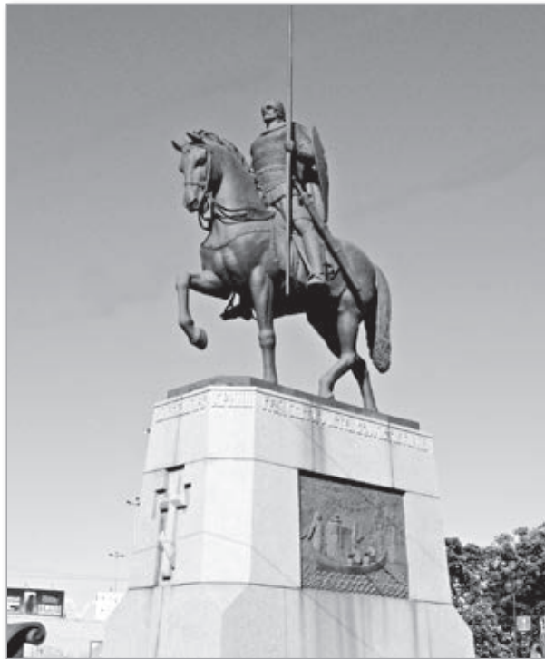
Памятник святому князю Александру Невскому на площади имени Александра Невского перед входом в Александро-Невскую Лавру

имеет смысла их замалчивать. Но его прославлением Господь показывает нам, что не отступления от праведности или впадение в те или иные грехи важнее всего в жизни человека. Вседержитель мира оценивает главное устремление жизни человека: к Свету ли оно, и это решает его участь в вечности. Святой не значит безгрешный, без греха един лишь Господь.