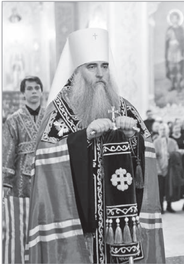
Митрополит Саратовский и Вольский Лонгин

вится естественным желание хотя бы какое-то время побыть одному или только с самыми близкими. Это чувство христианину приходится преодолевать, осознавая, что единство в Церкви, единство в Боге – это совершенно особое, благодатное состояние.