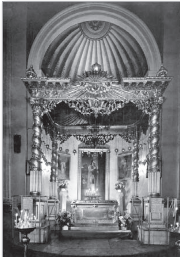
Рака с мощами святого князя Александра Невского в Свято-Троицком соборе

...Вот что хочется сказать, подытоживая разговор о святости благоверного князя Александра. Факты его суровости, даже жестокости известны, не