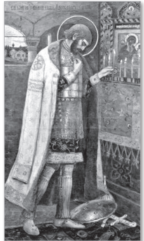
Святой князь Александр Невский

А уже в двадцать в знаменитой битве в устье реки Ижоры на Неве, перед которой он усердно молился в