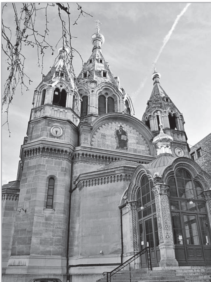
Собор во имя святого князя Александра Невского в Париже