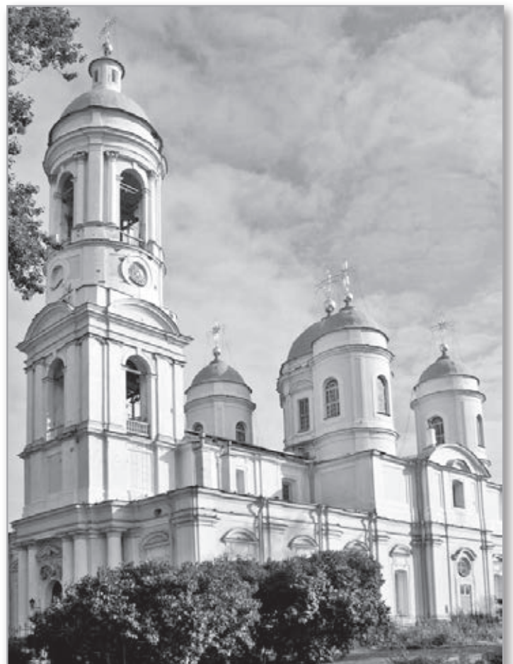
Князь-Владимировский собор в Санкт-Петербурге