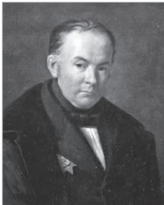
Василий Андреевич Жуковский

Прежде всего, внимание останавливается на самих личностях, которые вели между собою переписку: это были люди, честно и всецело посвятившие себя служению правды, дорожившие данным им от Бога талантом, искренно веровавшие в достоинство слова человеческого, возлюбившие науку всей силою своего ума и строго относившиеся ко всему, что выставлял им на показ цивилизованный Запад, – люди, освещавшие самые лучшие помыслы свои светом веры Христовой и Божественного Откровения, и потому-то память их пребывает донныне с похвалами, и потому-то имена их затверживали мы,