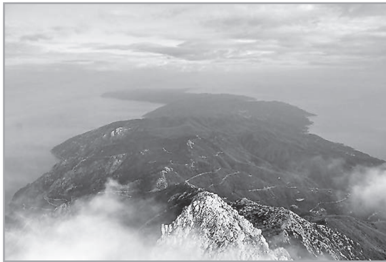
Вид на Афон с вершины Святой Горы.

Конечно, особенно трогательно вспомнить про Афон. На Афоне в храме стоит полная тишина. Если что-то необходимо сказать, то говорят шепотом или знаками. После того, как Господь впервые сподобил меня быть на Афоне, меня спросили: «Что такое Афон?» Сначала я замер, не зная, что сказать, а потом ответил: «Безмолвие. А-фон». «Фон» – это «звук». «Фо-