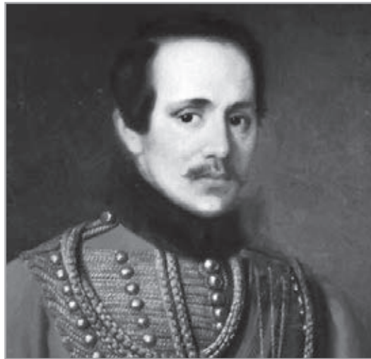
Михаил Юрьевич Лермонтов

С отвращением переносишь затем взоры свои к «конвульсивно скаредной литературе», как называет ее Плетнев в письме своем к Жуковскому от 4-го марта 1850 года, которая сложилась из «нестройной толпы наездников, поддерживаемых одним развратным невежеством провинциалов». «Вы, – говорит он знаменитому другу своему, – не можете и вообразить, до какой степени я теперь один, как все около меня умерло, чем пре-