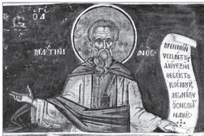
Преподобный Мартиниан Кесарийский

ницы, прося ночлега. Святой впустил ее, так как погода была ненастная. Но лукавая гостя переделалась в дорогую одежду и стала соблазнять подвижника. Святой выбежал из келлии, зажег костер и встал босыми ногами на пылающие угли. Он говорил при этом себе: «Трудно тебе, Мартиниан, терпеть этот временный огонь, как же ты будешь терпеть вечный огонь, приготовленный тебе диаволом?»