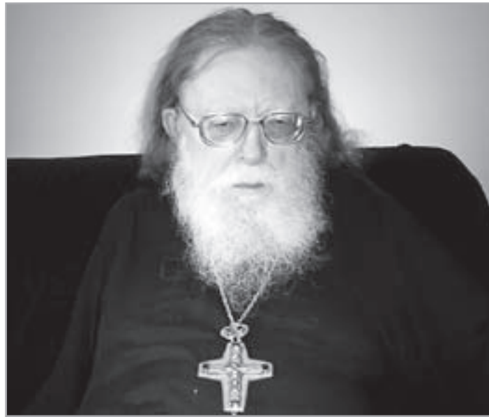
Архимандрит Рафаил (Карелин)

– Что касается обвинения Православной Церкви в «латинском пленении», то это крупномасштабная провокация модернистов, цель которой – найти благовидную причину для проведения своих разрушительных замыслов и реформ в самой Православной Церкви.