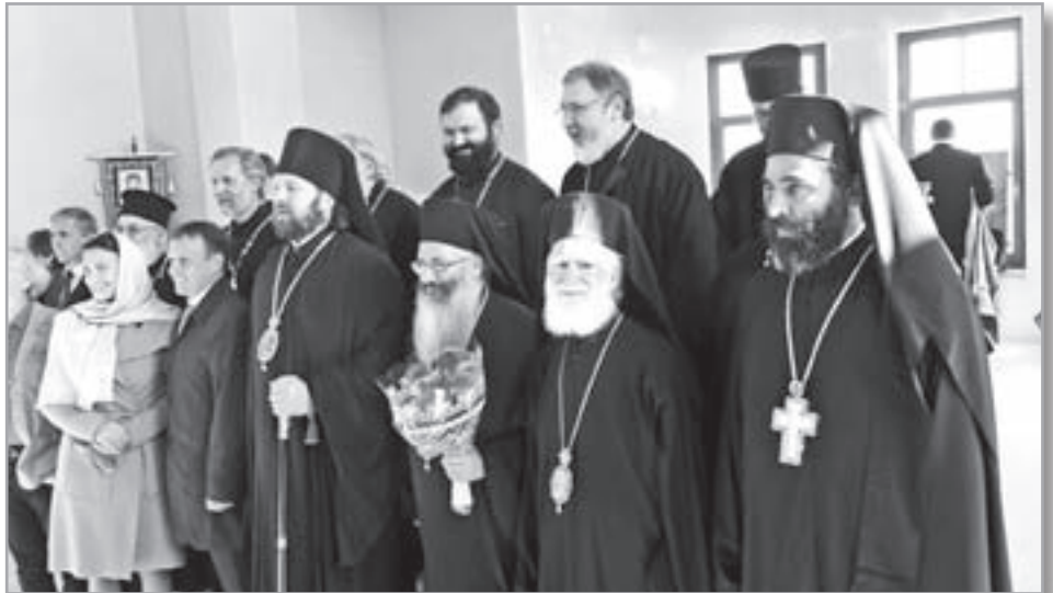
Встреча закончилась молитвенным обращением ко Господу. Божественную литургию возглавил епископ Гатчинский и Лужский Митрофан в сослужении четырех архиереев. Это была первая литургия в новом храме, освещенном в честь Рождества Пресвятой Богородицы, на праздник Рождества Пресвятой Богородицы в селе недалеко от города Павловска, расположенного в 30 км от Санкт-Петербурга. Большинство делегатов приняли участие в службе.

• церковь, при содействии Межпарламентской Православной комиссии,