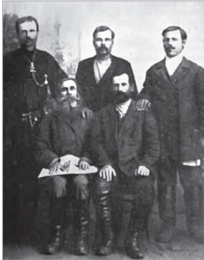
«Члены Общества трезвости, проживающие в Томске» (см.: Отчёт Казанского Общества Трезвости с 1-го января 1903 г. по 1 января 1904 г., читанный в Общем Собрании членов общества 25 Января 1904 года. – Казань: Типо-литография Императорского Университета, 1904. – С. /10/.)

ви», первый пункт которых гласил: «Общество имеет целью противодействовать употреблению спиртных напитков среди населения прихода, а для сего помогать нуждающимся членам советами, в случае особенной нужды, материальными средствами и приисканием занятий». По сути, это была «калька» с § 1 устава КОТ, утверждённого почти за десять лет до этого, где говорилось, что «общество имеет целью противодействовать употреблению спиртных напитков среди населения города Казани и для сего помогать нуждающимся членам советами, материальными средствами и приисканием занятий».