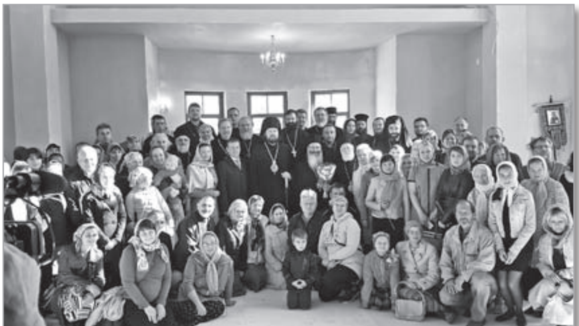
Епископ Гатчинский и Лужский Митрофан с участниками встречи и прихожанами после Божественной литургии 21 сентября 2014 года, в праздник Рождества Пресвятой Богородицы.

Мы отмечаем, что Православная Церковь ведет эту деятельность,