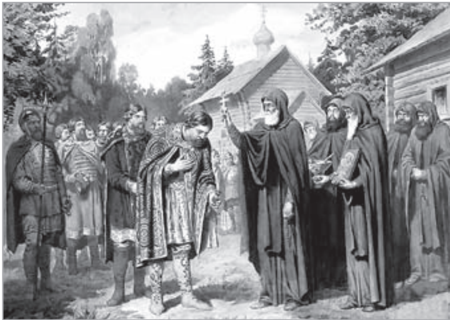
«Преподобный Сергий Радонежский благословляет Дмитрия Донского».

Человек – это огромная сила и потенциал, прежде всего не какими-то физическими качествами, а именно духом. Святость Сергия была очевидна для его современников. Видимым знаком его благословения битвы на Куликовом поле стали посланные из монастыря Пересвет и Ослябя.