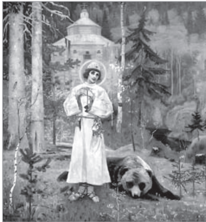
«Юность преподобного Сергия». М.В. Нестеров. 1892-1897 гг.

И мы знаем, преподобный Сергий активно способствовал объединению русских земель, притом действовал, отталкиваясь не от прагматических и политических интересов, но говоря о том, что жизнь