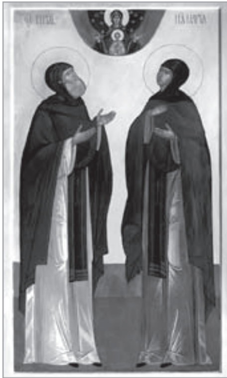
Икона «Преподобные Кирилл и Мария Радонежские»

Пост Мария соблюдала даже во время беременности, не давая себе поблажек. У супругов родилось три сына: Стефан, Варфоломей и Петр. Варфоломей (это имя означает «сын радости») в будущем станет основоположником русского монашества, преподобным Сергием, игуменом Радонежским. Но пока, в юности, он