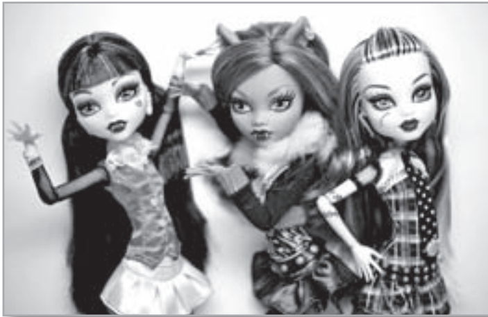
В последнее время большой популярностью у детей пользуются куклы Монстр Хай (Monster High)

В Сети девчонки 10-12 лет от Монстр Хай без ума, это какой-то массовый психоз. Они потребляют подробности из личной жизни этих вымышленных персонажей точно так же, как некоторые взрослые – подробности из личной жизни звезд. На сайтах Монстр Хай девочки выступают стилистами любимых кукол и даже подписываются их именами, т. е. в какой-то степени отождествляют себя с ними. А девчонки нашего города таскают с собой этих монстров, чтобы показать всем. Ведь модная кукла, помимо прочего, такая же статусная вещь как, например, сотовый телефон. Если сама кукла не по карману, то детей завлекают бесплатными online-играми с персонажами Монстр Хай.