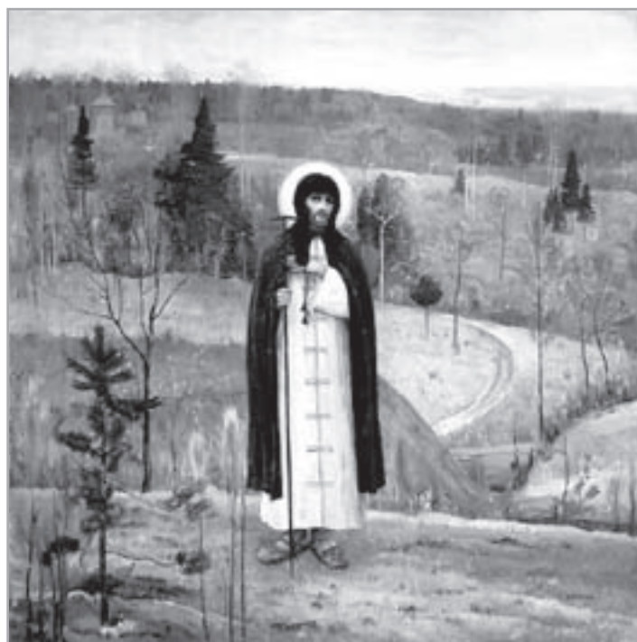
«Святой Сергий Радонежский». М.В. Нестеров. 1891-1899 гг.

Из проповеди Патриарха Кирилла после Литургии в Троице-Сергиевом Варницком монастыре, 11 мая 2014 года.