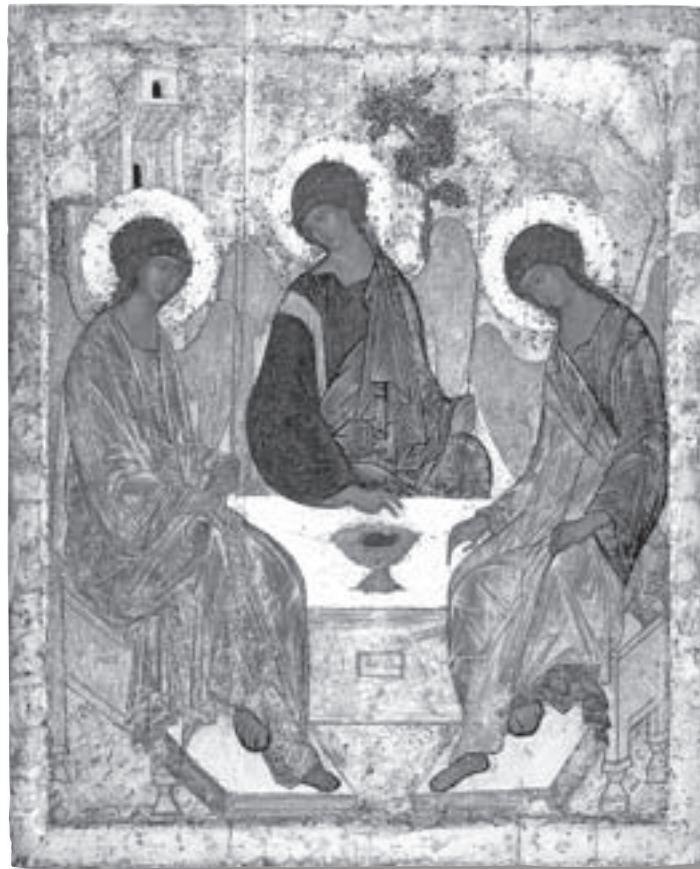
Икона «Троица». Андрей Рублев

Достаточно взглянуть на монастыри Северной Фиваиды, основанные учениками преподобного: Кирилло-Белозерский, Валаамский, Соловецкий монастыри и многие другие обители – чтобы понять, что функции