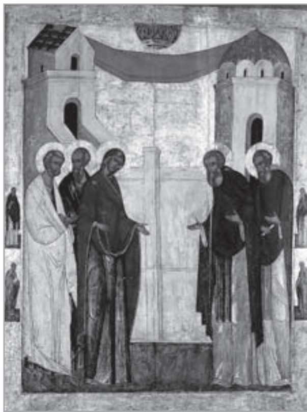
Икона «Явление Пресвятой Богородицы преподобному Сергию Радонежскому»

В то же время в православной традиции иконографии при сохранении определенного портретного сходства главное внимание уделяется точности раскрытия именно духовного образа святого. Икона не прижизненный портрет, а свидетельство в красках о состоявшемся преображении человека Святым Духом. Икона показывает не столько то, каким был человек при жизни, сколько то, каким он стал в Царстве Небесном. Поэтому иног-