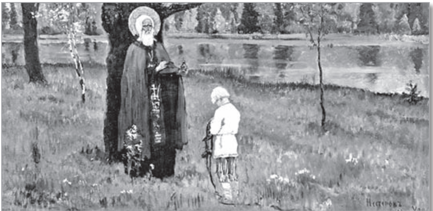
«Видение отроку Варфоломею». М.В. Нестеров. 1889-1890 гг.

Кирилл был уже стар, поэтому вместо него на службу князю поступил старший сын Стефан. И он, и младший Петр, были уже женаты.