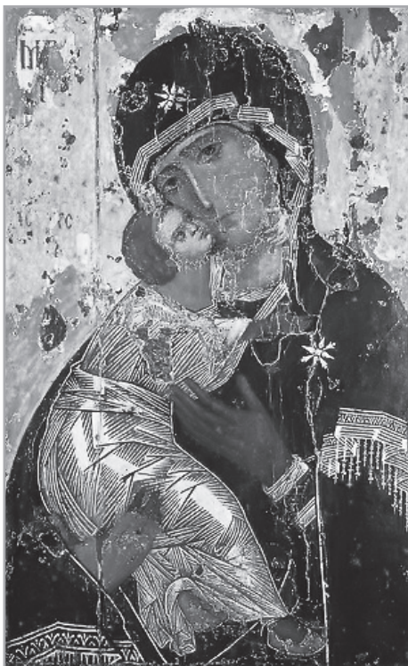
Владимирская икона Божией Матери

этот грех – и всё, поскольку плотской грех уже не мог бы иметь места. Двенадцать лет он ждал, чтобы только один взгляд и один греховный помысел оставил его и больше не терзал его состарившееся тело.