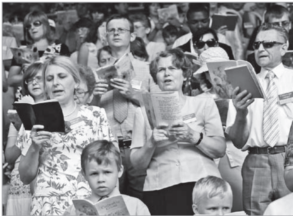
«Молитвенное» собрание «Свидетелей Иеговы»

Дорогие христиане-единоверцы, получив от «свидетелей» письмо, вспомните, что наши пути расходятся.