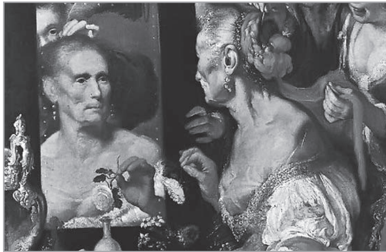
«Старуха перед зеркалом» Бернардо Строцци

Но, к сожалению, большинство девушек именно этого и хочет. Они хотят быть вожделенными. Тут уже нельзя говорить даже о том превосходстве, какое может иметь человек в сравнении с животным. Всё то вре-