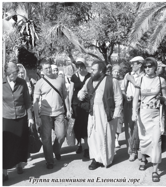
Группа паломников на Елеонской горе

— А как обстоит дело, скажем так, с кадровой проблемой? Ведь еще несколько лет назад, отправляясь в туристическую поездку можно было услышать от экскурсовода неподобающие слова о храмах, о христианских святынях, можно было увидеть небрежное отношение к убранству храма, некоторые сведения были искажены. Изменилась ли ситуация на сегодняшний день?