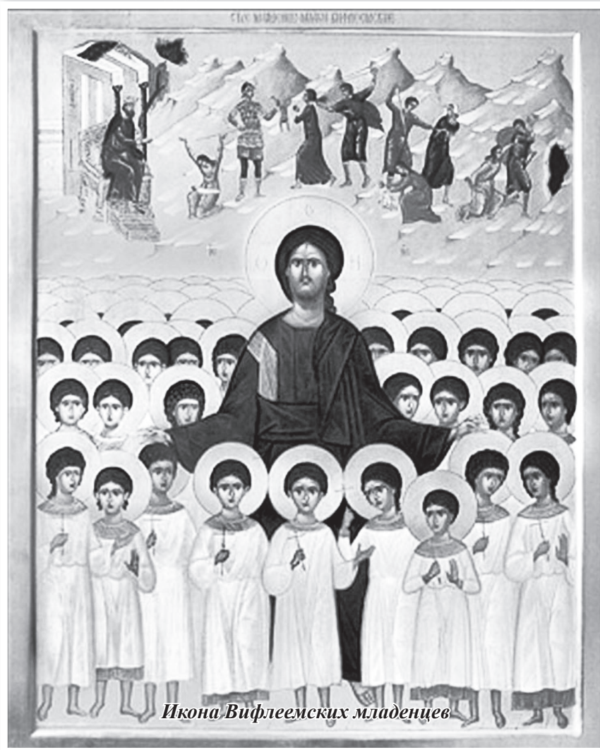
Икона Вифлеемских младенцев

речь шла о легализации абортов, довод «эдак вы и до убийства уже рожденных детей дойдете» звучал риторическим преувеличением. Сейчас это уже не преувеличение. До чего дойдет прогресс в будущем? На собраниях прогрессивных элит будут подавать хорошо прожаренных младенцев под красное вино? Тем более, что передовые мыслители (такие как Сингер и Докинз) уже признали, что ничего не имеют против употребления человечины в пищу.... То, что позавчера было жуткой, гротескной фантастикой, вчера – уважаемое мнение, сегодня – допустимая практика, а завтра