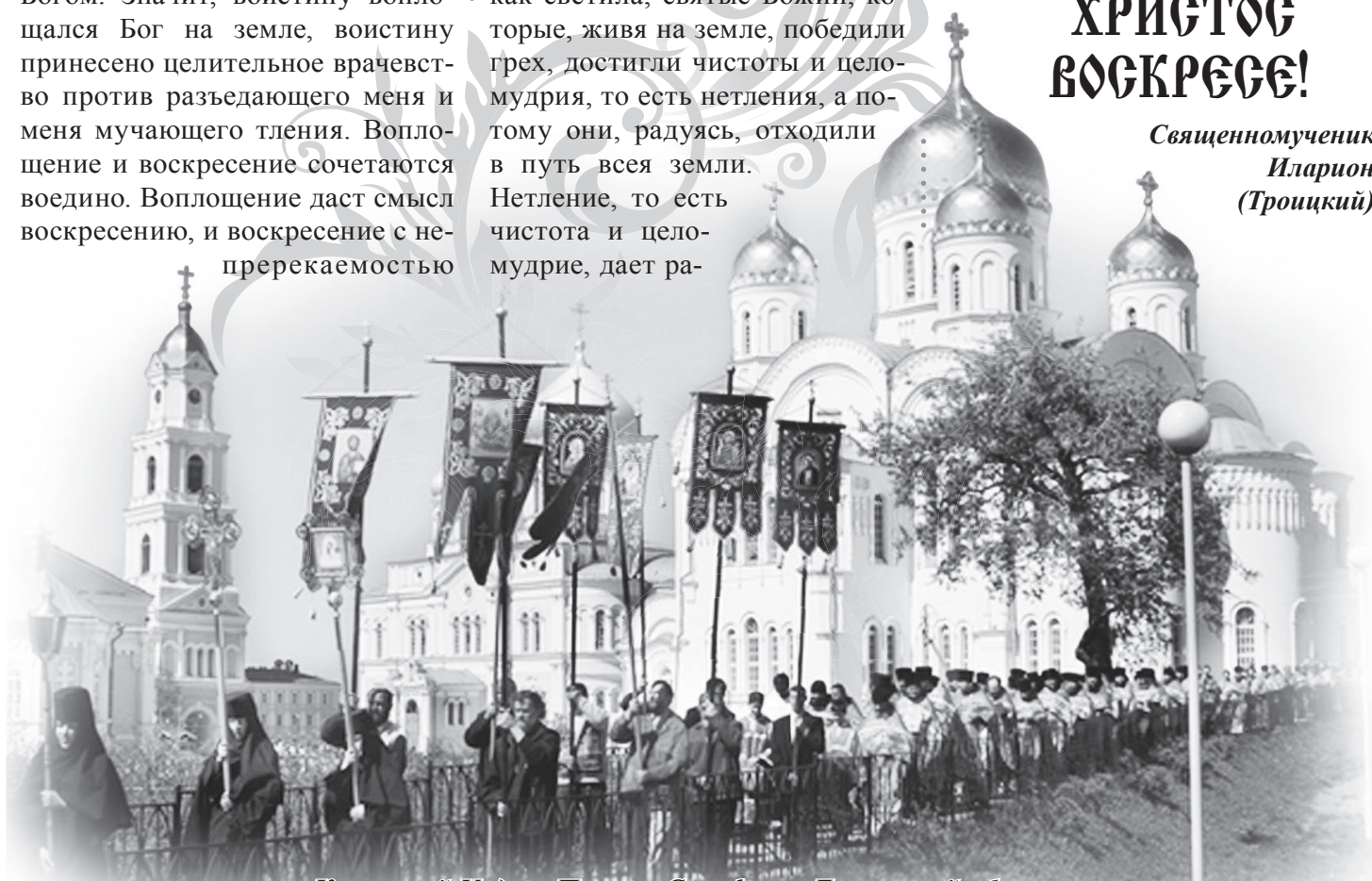
Крестный Ход на Пасху в Серафимо-Дивеевской обители