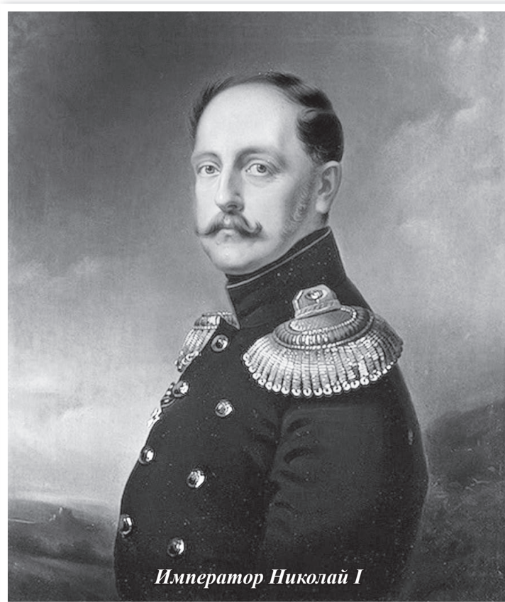
Император Николай I