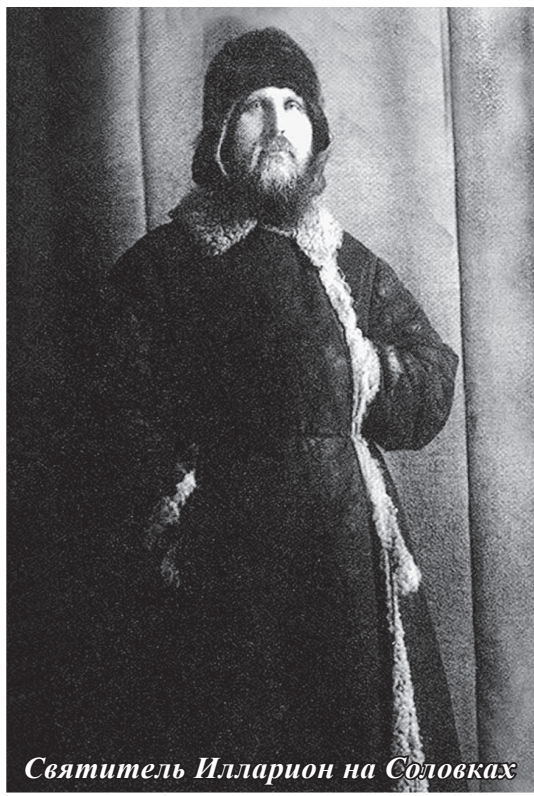
Святитель Илларион на Соловках

человеком. Грех называется по преимуществу преступлением против Бога, оскорблением Бога, за которое правда Божия должна отомстить ничтожному оскорбителю. Но Церковь грех называет прежде всего тлением, утратой древнего достояния – нетления. Здесь нет юридических счетов с Господом Богом. Человек отпал от Бога, и началось его духовное и телесное тление. Самозаконие в духовной жизни привело к рабству греху и страстям. Человек начал истлевать в обольстительных похотях. Душа гниет, душа истлевет. Это звучит странно, но на самом деле это так. Процесс духовного тления можно уподобить всякому гниению. Если гниет какой организм, в нем все разрушается, временами появляются из него ядовитые и зловонные газы. Так и духовная природа, поврежденная, зараженная грехом, будто гниет. Душа теряет свое цело-