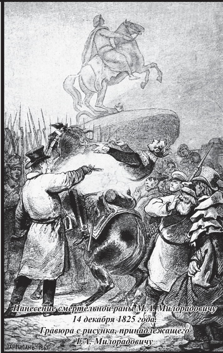
Нанесение смертельной раны М. А. Милорадовичу

Объективных причин для мятежа не было, особенно для дворян-офицеров. Империя была на взлете своего могущества: сокрушен Наполеон, территория империи увеличена за счет Варшавского герцогства, русская армия – самая могучая сила на планете, только что добившая одного из самых талантливых полководцев в истории человечества, входившая в