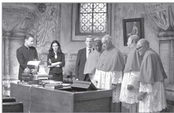
Кадр из фильма «Ангелы и демоны»

Кроме того, если мы подойдём к поднятой автором проблеме, так сказать, с философской точки зрения, то обнаружим, что пресловутого конфликта между научным и религиозным, как такового, собственно говоря, и нет. Наука и религия име-