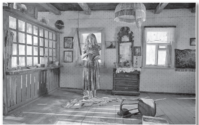
Кадр из к/ф «Чудо»

рекомендую всем его обязательно посмотреть».