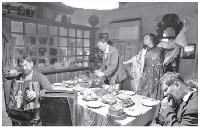
Кадр из к/ф «Чудо»

будет толчком к переосмыслению своей жизни и к духовному преображению».