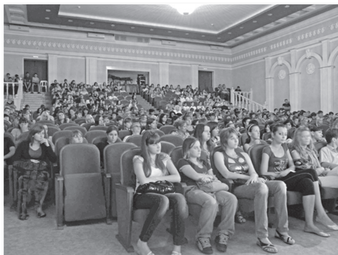
На показе фильма «Перелом»